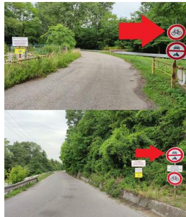
Text a foto: OcÚ Bystričany

Ústretový krok v prospech kvalitnejšej a ekologickejšej mobility si vážime a priateľom z elektrární aj vo vašom mene ĎAKUJEME . Nezabudnite však, že zákaz vjazdu motorových vozidiel stále platí a stále ide o súkromný pozemok, ktorý je monitorovaný kamerovým systémom a strážený. Prosíme, buďme za ústretový krok vďační a rešpektujme osobné vlastníctvo aj platné dopravné predpisy.