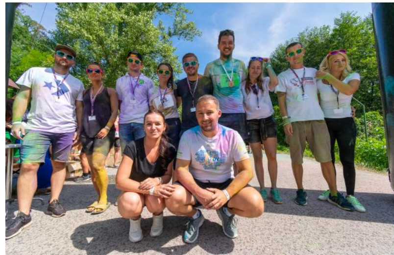
Text: OcÚ Bystričany