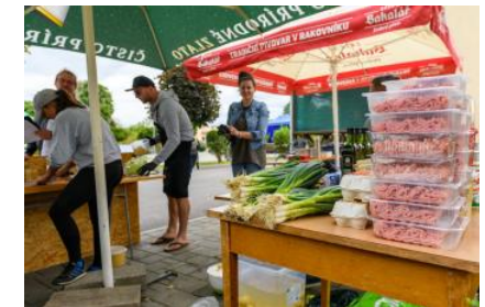
Text: OcÚ Bystričany