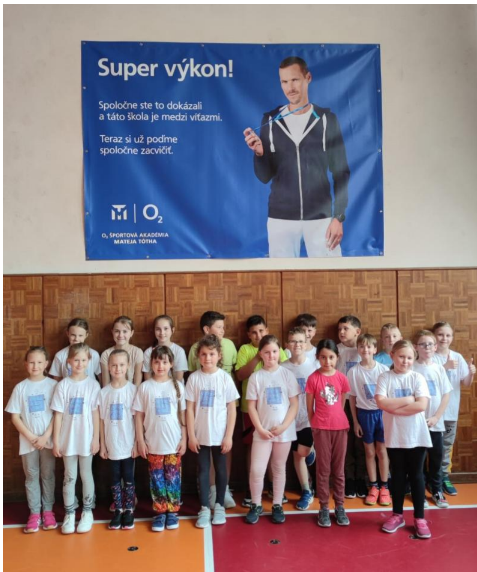
Projekt Erasmus+, účastníci kempu na Slovensku, Horná Ves.

Dve oddelenia školského klubu detí pre žiakov 1. – 5. ročníka pracovali tiež s obmedzeniami vyplývajúcimi zo školského semafora. Postupne sa s uvoľňovaním týchto opatrení rozširoval okruh aktivít pre najmenších žiakov. Na jeseň 2021 bol záujem sústredený na tvorenie z ovocia a zeleniny a iné jesenné tvorivé aktivity, zavŕšené veselou halloweenskou párty. Zima bola síce skúpa na sneh, ale zimné a vianočné hry si deti užili na školskom dvore aj v klube. Na jar sa časť činnosti klubárov presunula aj do exteriéru, deti sa hrali na školskom dvore a na ihriskách. Pozornosť venovali aj vzdelávacím a čitateľským aktivitám, besedám, umeleckým a tvorivým činnostiam.