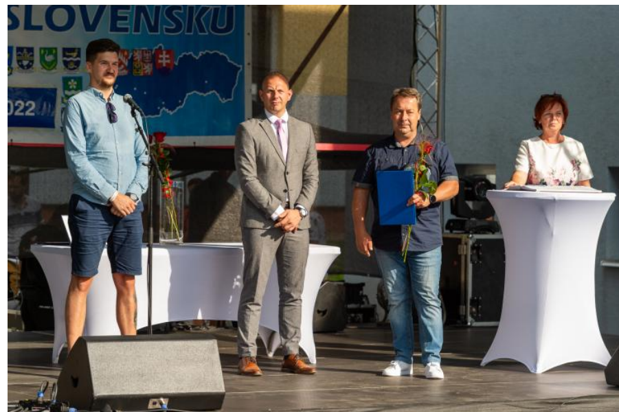
Text: OcÚ Bystričany

Laureátom ocenenia Bystričiansky štvorlístok 2022 srdečne blahoželáme a ďakujeme za ich obdivuhodnú prácu. Už teraz sa tešíme na laureátov aktuálneho roka.