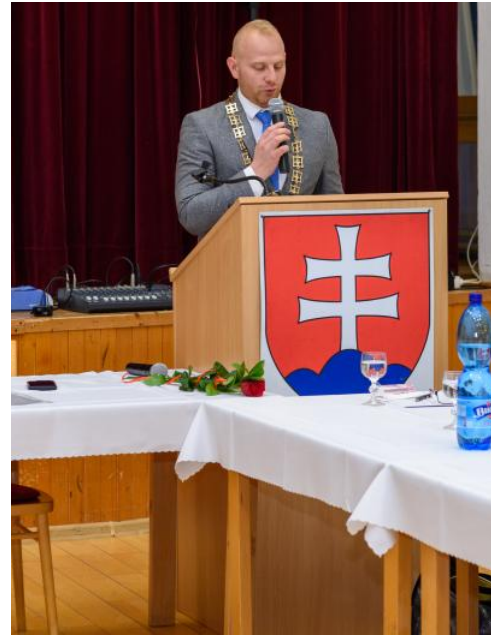
Text: OcÚ Bystričany