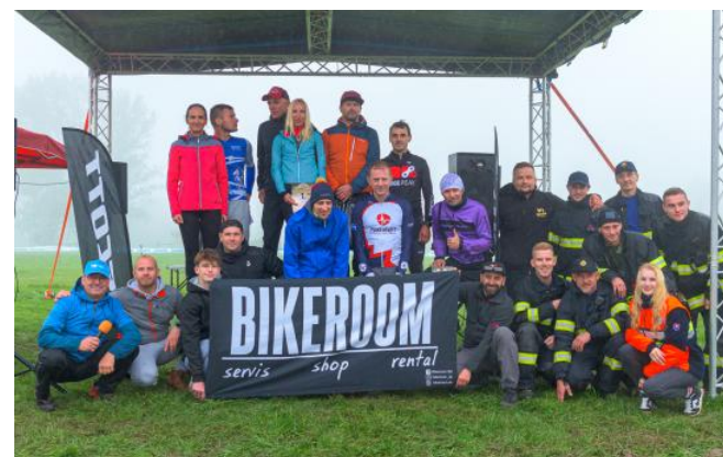
Text: OcÚ Bystričany