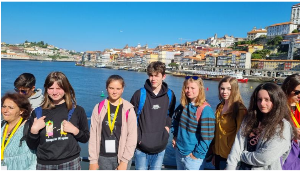
Žiaci ZŠ na prehliadke mesta Porto počas kempu v Portugalsku.

Tu účastníci dokončili tvorivú prácu na projekte, a navštívili mestá Porto, Braga, Barcelos s veľmi zaujímavou históriou a tradíciami. Záverečným stretnutím a vyvrcholením projektových aktivít bola medzinárodná konferencia v júni 2022 v Bukurešti (Rumunsko), na ktorej zúčastnené školy prezentovali výsledky projektu. Realizácia projektu v programe Erasmus+ umožnila pedagógom i žiakom aktívnu účasť na workshopoch aj medzinárodných mobilitách,