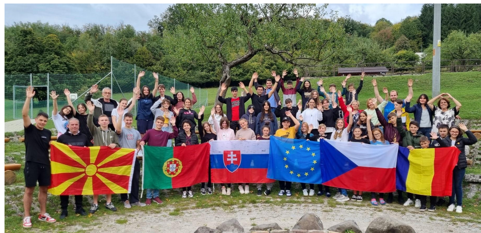
Projekt Erasmus+, účastníci kempu na Slovensku, Horná Ves.

triedami a dvomi oddeleniami školského klubu detí. V základnej škole pracovalo 17 pedagogických zamestnancov, z nich boli traja asistenti učiteľa a jeden špeciálny pedagóg, na ktorých škola získala finančné prostriedky z rôznych grantových schém. Nepedagogických zamestnancov bolo deväť, z toho štyria v školskej jedálni, traja prevádzkoví a dvaja ekonomickí zamestnanci. V škole umožňujeme aj umelecké vzdelávanie našich žiakov prostredníctvom elokovaných pracovísk dvoch škôl: hudobný odbor otvára Súkromná základná umelecká škola Prievidza a výtvarný odbor Súkromná základná umelecká škola Ars Academy Veľké Uherce.