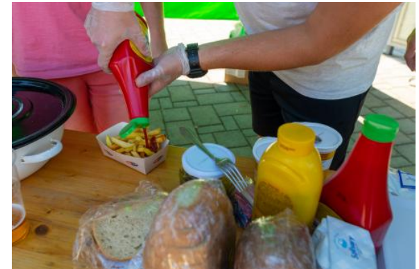
Text: OcÚ Bystričany