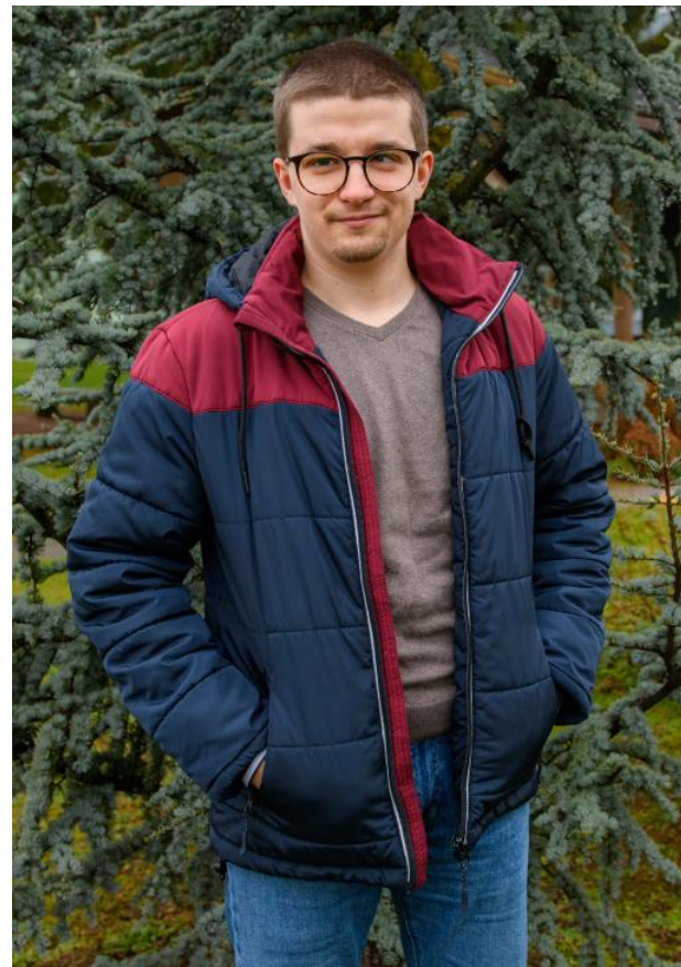
Text: OcÚ Bystričany

Vďaka týmto návykom z detí vyrastú plnohodnotní občania s lepšími podmienkami na život. Tomáš činnosť tohto združenia považuje za extrémne dôležitú. „Štát, aj napriek pár vydareným projektom, v tejto oblasti dlhodobo zlyháva, takže je podstatné podporiť združenia, ktoré robia de facto jeho prácu. Ak chceme rómske deti integrovať, dá sa to len takouto drobnou každodennou prácou.“ Rád by inšpiroval aj iných, aby keď majú jedno – dve eurá mesačne nazvyš, prispeli. Pretože ako už naznačil, pre jednotlivca nejde o veľkú sumu, rozhodujúci je počet ľudí, ktorí pravidelnými drobnými príspevkami môžu zlepšiť spoločnosť a životy ľudí v nej.