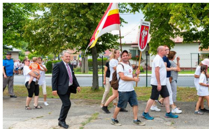
Text: OcÚ Bystričany